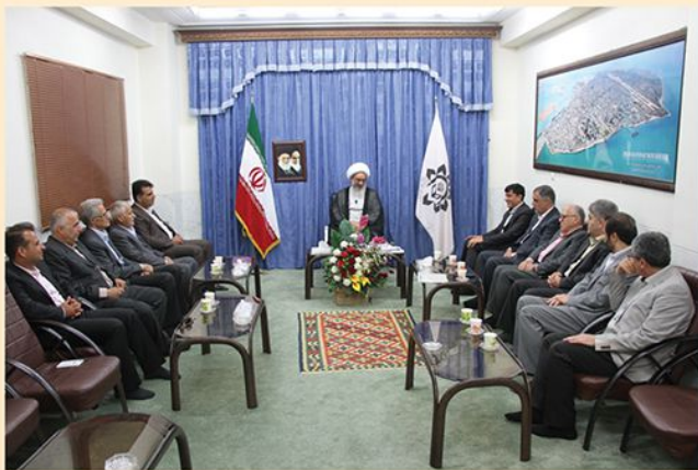
هیأت اعزامی در محضر نماینده ولی فقیه و امام جمعه محترم استان بوشهر

موضوع اصلاح و بهبود وضعیت سیلندرهای در چرخه توزیع گاز مایع استان بوشهر بخصوص جنوب استان که موجبات گلایه مدیرکل محترم استاندارد استان بوشهر را فراهم آورده بود، با حضور ایشان در جلسه مورخ ۹۷/۱۲/۲۰ کمیته نظارت بر بازسازی و جایگزینی شیر و سیلندر مرکز مورد بررسی و رسیدگی قرار گرفت و در جهت ارتقاء سطح ایمنی و بهینه نمودن چرخه توزیع آن استان، اختیارات لازم از سوی کمیته مرکزی به کمیته استان بوشهر تفویض گردید و به دنبال آن بنا به دعوت مدیرکل استاندارد استان بوشهر هیأتی از کمیته نظارت مرکز شامل: دبیر انجمن، دبیر کمیته بازسازی، نماینده شرکتهای گروه دوم در کمیته نظارت مرکز و کارشناسان مربوطه در مورخ ۹۸/۰۲/۱۰ به