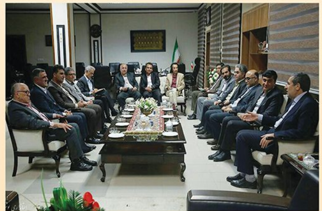
هیأت اعزامی در محضر استاندار محترم استان بوشهر