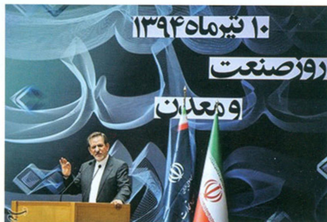
دکتر اسحاق جهانگیری معاون اول ریاست جمهور هنگام ایراد سخنرانی