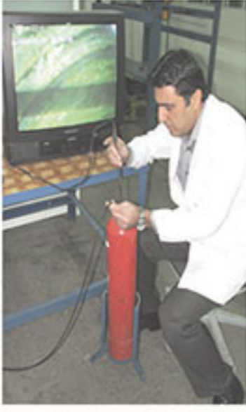
نحوه بازرسی داخلی چشمی از داخل کپسول به کمک چشم مسلح (دستگاه ویدئواسکوپ)