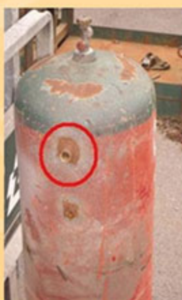
جوشکاری غیرمجاز روی بدنه سیلندر