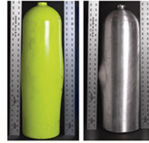
تغییر شکل و انحراف از طرح اصلی کپسول