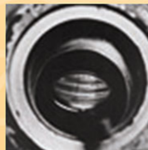
ترک رزوه های مهره اتصال شیر