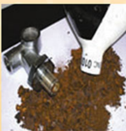
خوردگی شدید داخلی ناشی از عدم بازدید دوره ای که باعث کاهش شدید وزن می شود