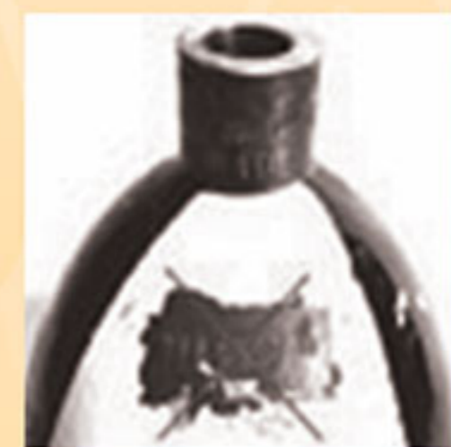
عدم قابلیت شناسایی کپسول