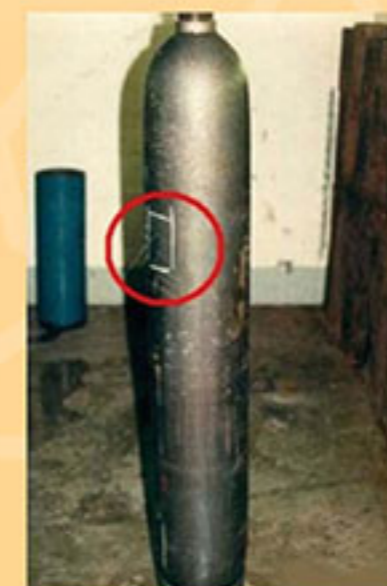
محل نشست در بدنه سیلندر هنگام تست دوره ای

انجام آزمون هیدرواستاتیک به روش انبساط حجمی در دستگاه ژاکت آبی به دلیل اندازه گیری میزان انبساط کپسول در وضعیت دائم و اندازه گیری برگشت پذیری آن در حالت الاستیک، کاملترین تست جهت کپسول و سیلندرهاي فولادی بدون درز از جمله CO 2 می باشد. براساس استاندارد در صورتی که میزان انبساط دائم مشاهده شده بیش از ۱۰٪ اندازه گیری شود، علیرغم تحمل فشار اعمال شده به سیلندر در فرآیند آزمون، لازم است سیلندر از رده خارج شود.