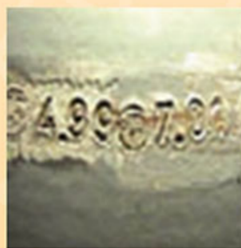
عمق بیش از حد مجاز حروف و حک در محل غیرمجاز