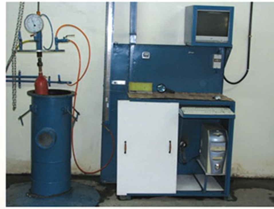
نحوه آزمون کپسول به روش انبساط حجمی در دستگاه ژاکت آبی