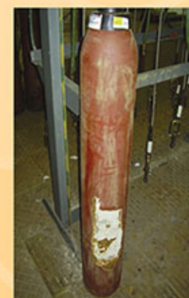
پوسیدگی وسیع در بدنه کپسول