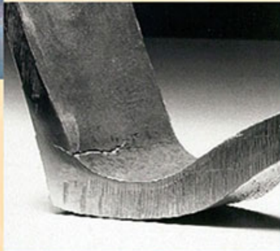
ترک در سطوح داخلی که در بازرسی چشمی به کمک بوراسکوپ مشاهده گردید