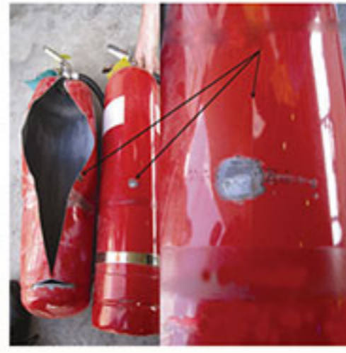
فرسودگی در بدنه ناشی از فشار قلاب دور کپسول در دوره مصرف