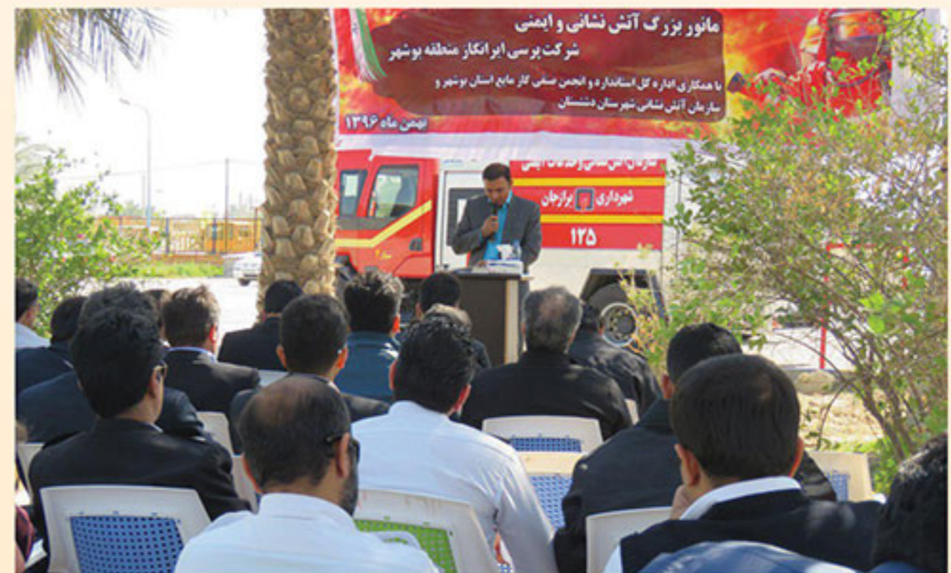
برگزاری کلاس آموزشی در استان بوشهر توسط نماینده انجمن